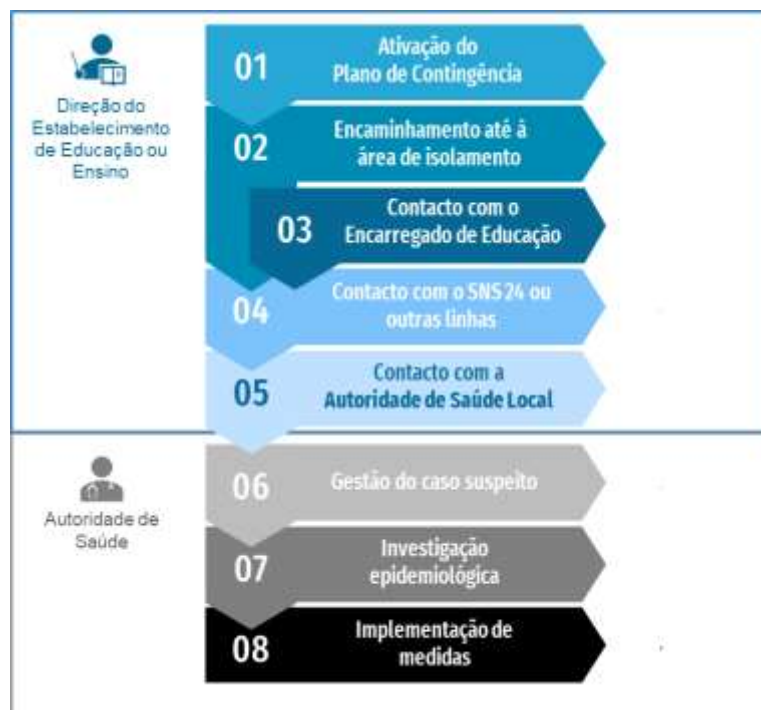
Figura 1. Fluxograma de atuação perante um caso suspeito de COVID-19 em contexto escolar

Perante a identificação de um caso suspeito, devem ser tomados os seguintes passos: