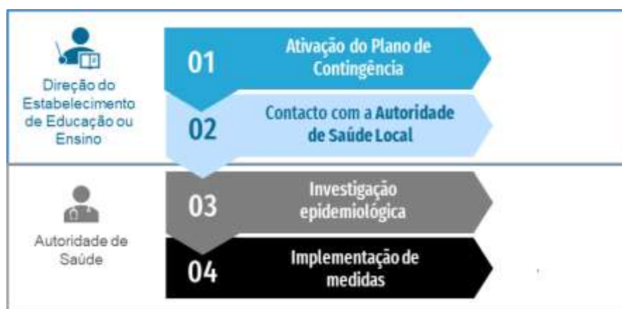
Figura 2. Fluxograma de atuação perante um caso confirmado de COVID-19 em contexto escolar

Se o caso confirmado tiver sido identificado fora do estabelecimento de educação ou ensino, devem ser seguidos os seguintes passos: