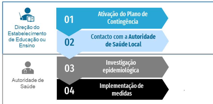
Figura 2. Fluxograma de atuação perante um caso confirmado de COVID-19 em contexto escolar