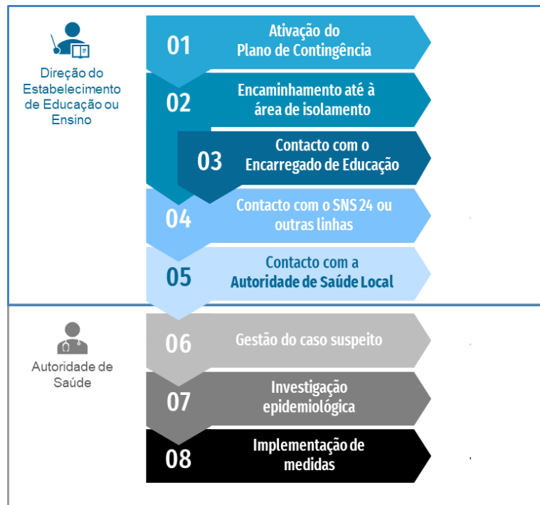
Figura 1. Fluxograma de atuação perante um caso suspeito de COVID-19 em contexto escolar

Perante a deteção de um caso possível / provável de COVID-19 de uma pessoa presente no estabelecimento de educação ou ensino, são imediatamente ativados todos os procedimentos constantes no seu Plano de Contingência e é contactado o ponto focal (Anexo 1).